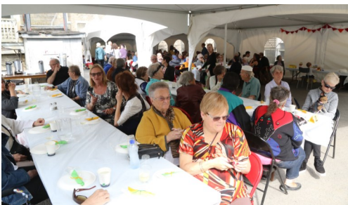
Les habitués des fêtes d'Aurore n'ont pas été déçus par le menu!