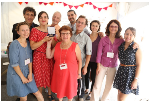
Amir Khadir a remis la médaille du mérite à la Maison d'Aurore, un beau cadeau!