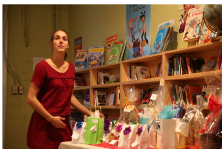
Une vingtaine de cadeaux pour le tirage, offerts par les commerces du quartier

Lundi 14 novembre en soirée a eu lieu la 5ème édition du souper gastronomique annuel de la Maison d'Aurore. Cet événement festif et gastronomique a régalé les fins palais d'une soixantaine d'invités, venus spécialement encourager la Maison d'Aurore.