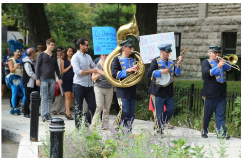
La fanfare des Faux-Nez a lancé les festivités avec une joyeuse parade!