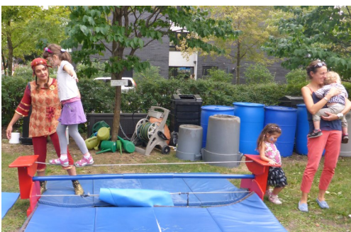
De nombreuses animations, dont un atelier de cirque, étaient offertes.

Le samedi 17 septembre, la Maison d'Aurore célébrait ses 40 ans d'existence en excellente compagnie!