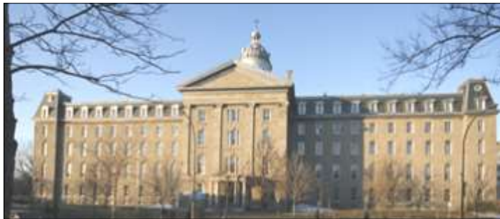
L'ancien institut des sourdes, situé au 3725 Saint-Denis, fait l'objet d'une importante mobilisation afin que le bâtiment reste au service de la communauté.

Le 20 novembre dernier, le Comité logement du Plateau Mont-Royal, en collaboration avec l'Association du Québec pour enfants avec problème auditif du Montréal régional (AQEPA) et le Centre communautaire de la communauté sourde du Montréal Métropolitain (CCSMM) soulignaient le lancement de la Maison Ludivine Lachance, un OBNL d'habitation qui verra le jour sur le site de l'ancienne Institution des sourdes.